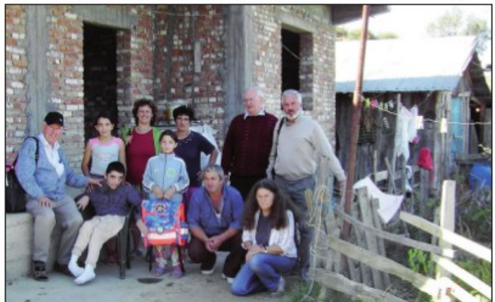
Eine Initiative der OÖ. Bezirksabfallverbände, ORA Österreich und der OÖ. LAVU AG!