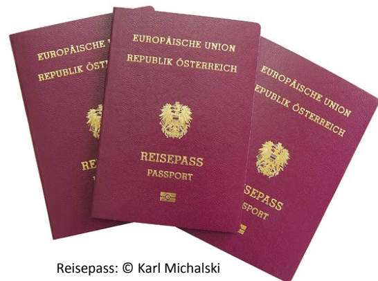
Reisepass: © Karl Michalski

Alle Informationen zum Reisepass finden Sie auf der Website des Innenministeriums www.bmi.gv.at .