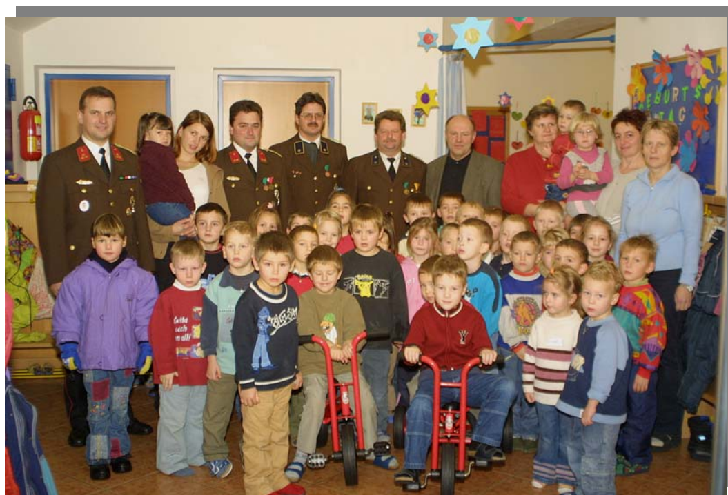
Für die großzügige Spende danken Kindergartenleitung, Kinder und Gemeinde recht herzlich!