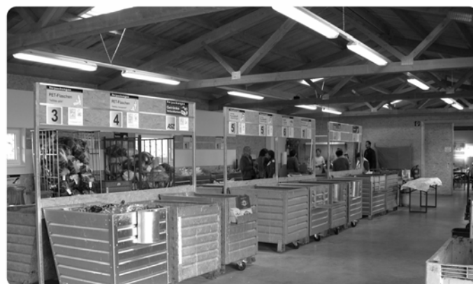
ASZ – Sammelsystem

möglich. Das getrennte Sammeln im ASZ ist somit ein wichtiger und nachhaltiger Beitrag sowohl für die Ressourcenschonung als auch für den Umweltschutz.